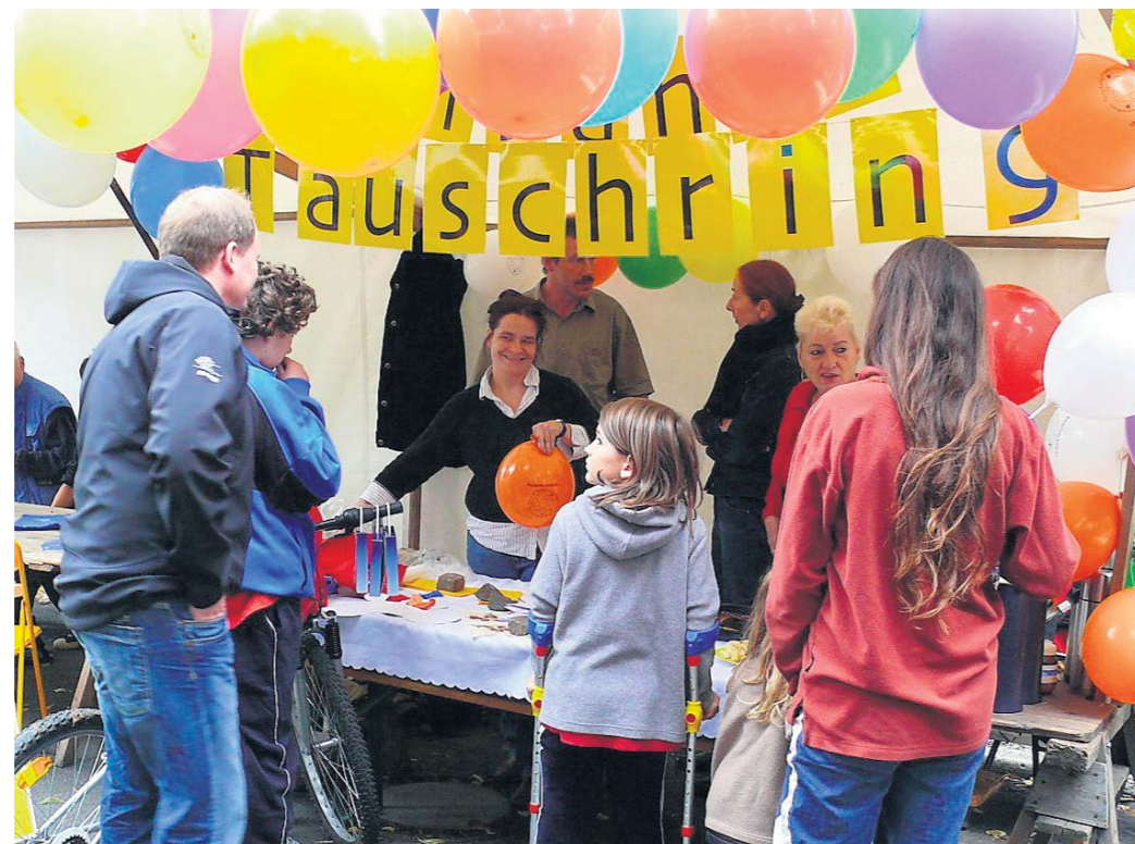
Der Tauschring Berlin-Friedrichshain hat schon viele Menschen von der Idee des Tauschens überzeugt.

Keckel engagiert sich seit mehr als vier Jahren im Tauschring Friedrichshain. Mittlerweile gehört sie zum fünfköpfigen Organisations-Team. Zu den Aufgaben gehören Büroarbeiten, ebenso wie Flyer oder Newsletter verteilen. Als sie 2004 zum ersten Mal tauschte, war sie sofort begeistert. Die Kommunikationsdesign-Studentin: „Ich fand die Idee einfach toll. Als Alternative zum täglichen Kommerz. Und: Aus vielen Tauschbekanntschaften haben sich längst Freundschaften entwickelt.“