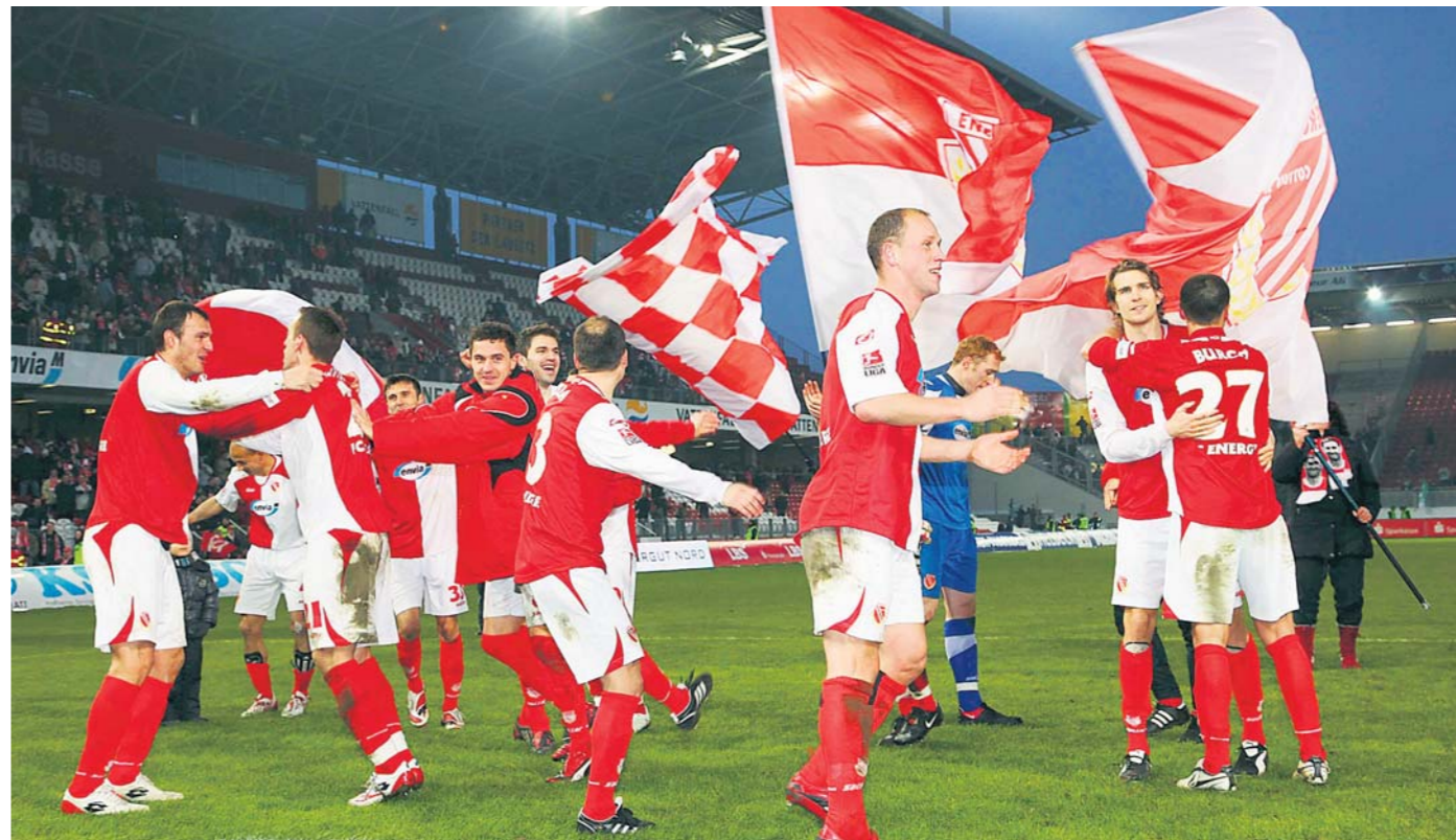
Der FCE hofft, dass Bochum den Gast als zu defensiv unterschätzt und will im Kellerduell punkten.

20cent sagt servus zum fußballerischen Wegbegleiter durch fünf Jahre Lausitzer Alltag. Wir haben mit dem Club gelitten, gebetet und gejubelt. Unvergessen bleiben die Eindrücke des Aufstiegs in das Oberhaus und der seitdem alljährlich erfolgreiche Kampf um den Klassenerhalt. Zwar verstand man sich nicht in jeder kritischen Situation erstklassig, doch sei es drum - immerhin war Energie Cottbus nie erfolgreicher als in der Zeit, in der 20cent über den Verein berichtete. Momentan sieht es ja so aus, als würde der Trend weiter nach oben gehen. In diesem Sinne wünscht 20cent der Mannschaft und dem Verein alles Gute für die Zukunft, eine erfolgreiche Rest-Saison und hoffentlich noch viele Jahre in der ersten Bundesliga. Die guten Wünsche gelten auch für alle anderen Sportvereine der Region, die unermüht ihr Bestes geben.